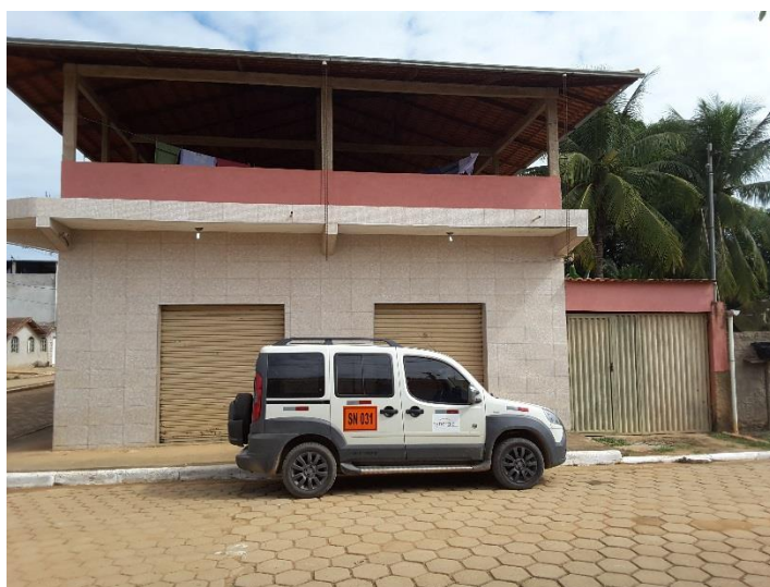
Figura 1. Registro fotográfico da visita.

No dia 09/06/2017, equipe técnica da empresa Synergia, enviou SMS para os números declarados pelo manifestante, com o objetivo que a família entre em contato com a empresa para realização do Cadastro Integrado.